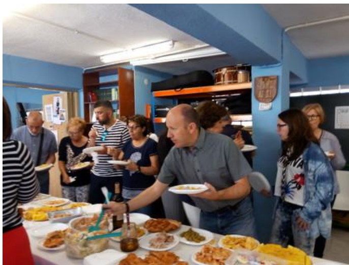
Comensais servíndose no bufé.

O sábado 10 de xuño tivemos unha comilona no local digna dun buffet de catro estrelas, polo menos.