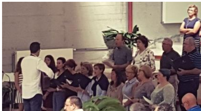
Alegrando unha celebración especial.

vez para volver e desfrutar á nosa forma, que e cantando .