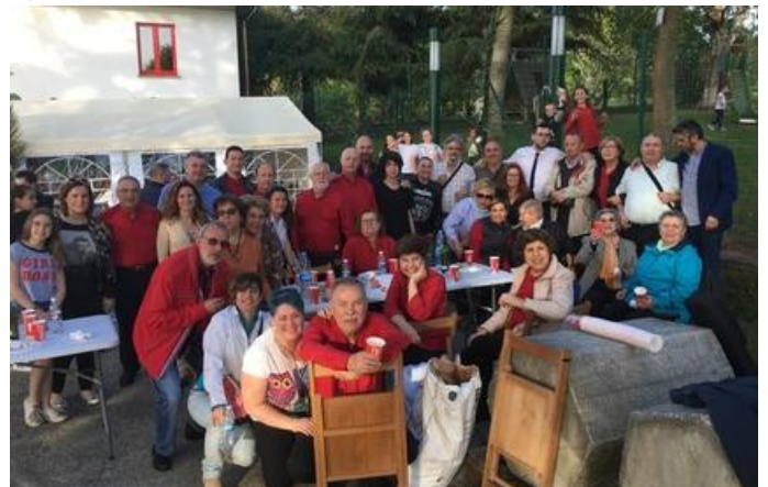
Preparados e preparadas para a enchenta e os posteriores cantos.

A grande asistencia de público fixo posíbel que os diferentes grupos recibisen un baño de calurosos aplausos.