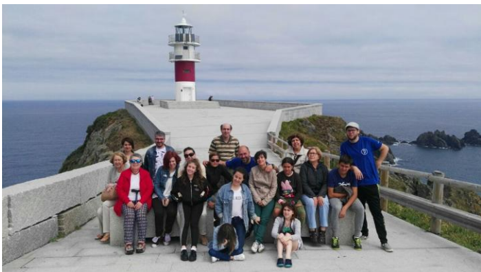
Os excursionistas no camiño da luz.

Outra parada foi no mirador da Herveira, desde onde non alcanzamos ver nada agás nubes. E iso que está sobre os acantilados máis altos da Europa continental. Pola contra, si que vimos moitos cabalos e eguas que pacían libremente por aquela contorna.