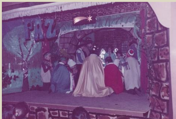
25/12/1982. Representación teatral do Nadal.