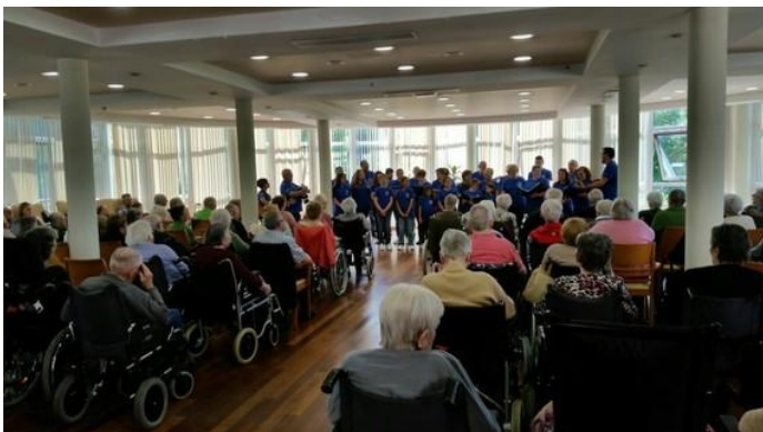
O salón encheuse para gozar das cancións.