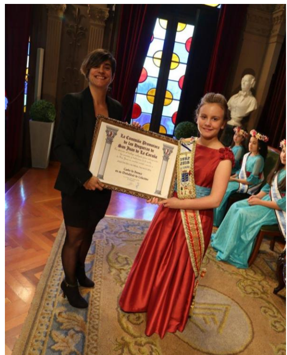
A Presidenta recibindo a distinción de mans da Meiga Maior Infantil.