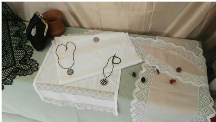
Arte, deseño e estilo.

a creatividade e a diversión. Ese é o meu pequeno propósito para quen se anime a se achegar ao local e probar. E iso ímolo intentar coa vosa axuda e coa miña desde a aprendizaxe".