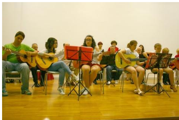
Novos artistas e non tan novos.

O sábado 17 de xuño celebramos o Festival de Fin de Curso de Tanxedoira no salón de actos do centro cívico de Novo Mesoiro, foi un día moita calor, mais calurosos tamén foron os aplausos que houbo pola cultura e a arte mostradas no festival, e que imos repasar.