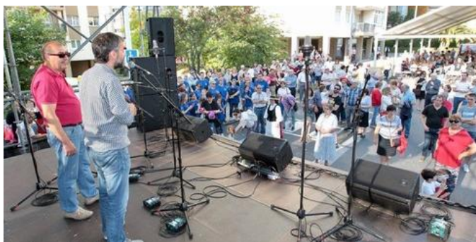
O alcalde presentando a xornada cos membros de Tanxedoira presentes.

O pasado 16 de xuño fomos convidados pola AA.VV. Monelos-Pajaritas a celebrar a festa do barrio que daba a benvinda ao verán. E como non podía ser doutro xeito, os tanxedeiros e tanxedeiras colaboramos encantados para amenizar o día do residentes desta zona coruñesa. Deleitamos os peóns cun pasarrúas variado e alegre pola mañá, que comenciamos na porta do mercado de Elviña-Monelos. Logo desplazámonos até unha sobrada praza diante dos Novos Ministerios, onde se nos uniu un espontáneo (funcionario, para máis sinais), que estaba tomando un café e arrincouse a canturrear con nós. A seguir, cantamos diante do bar Píscolabis e rematamos a xornada matutina no coñecido bar Jockey da rúa Brasil, onde nos agasallaron cunha saborosa empanada e auga fresca. Pasámolo de marabilla.